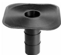
Водоприемник (Воронка) Ø 100 h250mm.