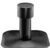
Отдушник Ø 100 h270mm.